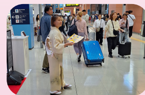
関西国際空港 観光PR