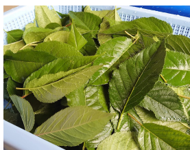
■収穫した大島桜の葉