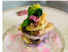
■夕食 さくら料理(イメージ)