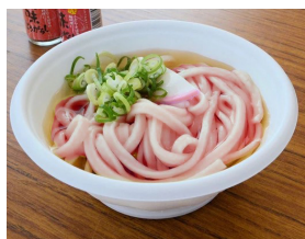
■昼食 桜うどん(イメージ)

【参加者各自でご用意していただくもの】 作業着(長袖シャツまたは腕カバー、汚れてもいい服装)、タオル、手袋 など