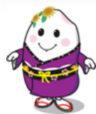
まめっこまいちゃん